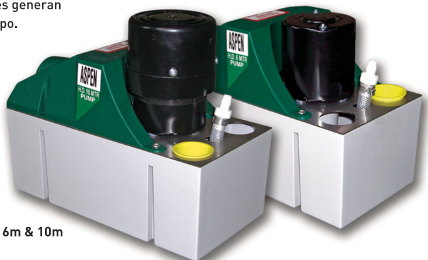
Heavy Duty 6m & 10m