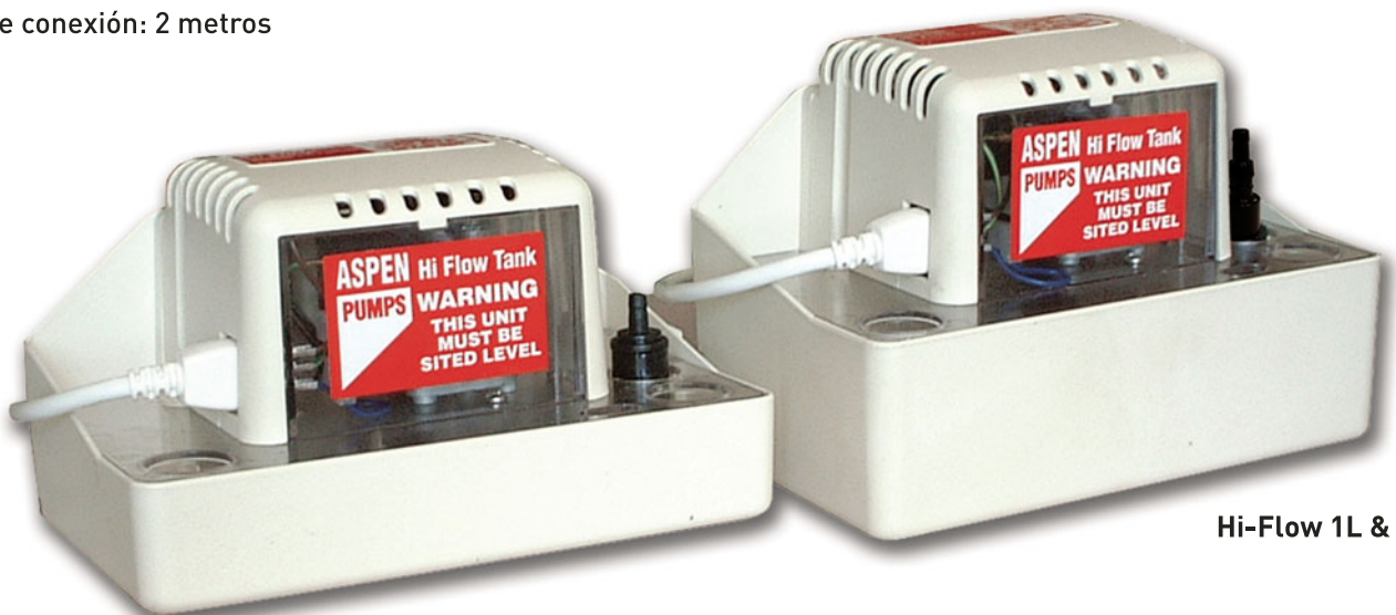
Hi-Flow 1L & 2L