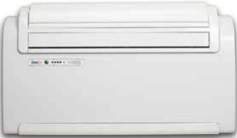
Design by King & Miranda